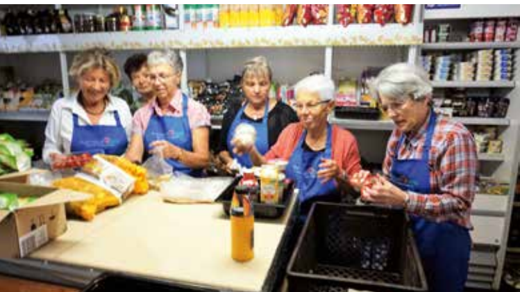
Bild: Ausgabestelle EUGENDORF

Alle Waren werden vor Ausgabe streng und verantwortungsvoll von uns überprüft. Die Verwendbarkeit muss von den BezieherInnen aber selbst noch einmal kontrolliert werden. Die Flachgauer Tafel haftet nicht für die ausgegebenen Lebensmittel.