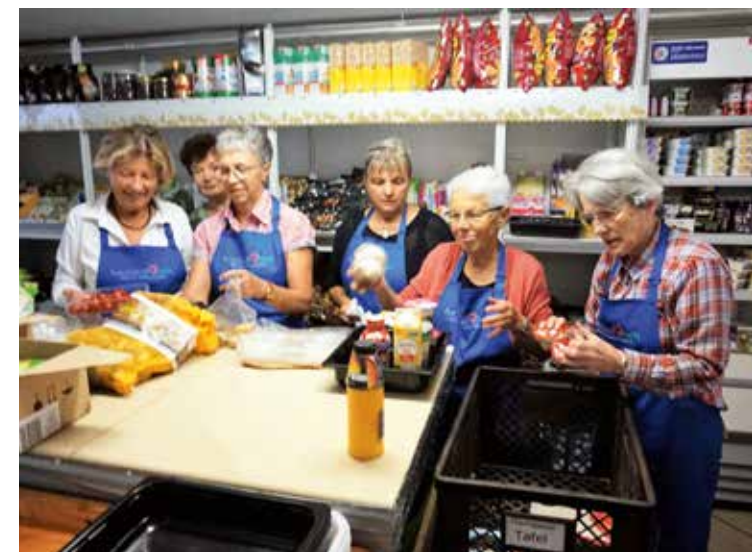
Bild: Ausgabestelle EUGENDORF